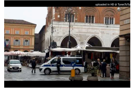
ce dei Piacentini. Negozi chiusi la domenica, favorevoli o contrari