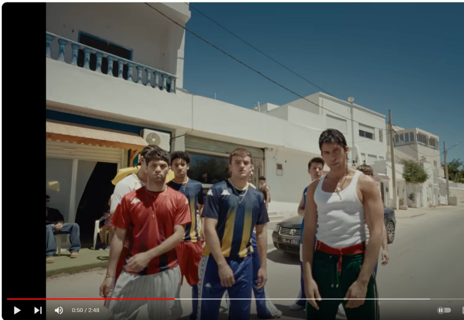
Mahmood - RA TA TA

La canzone parla di ragazzi che vivono in quartieri difficili. A volte è difficile essere bambini senza opportunità. Alla fine però vince l'umanità e la passione. La musica e l'amicizia sono molto importanti nella vita. La canzone è molto ottimista.